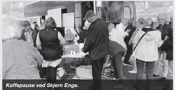
Kaffepause ved Skjern Enge.