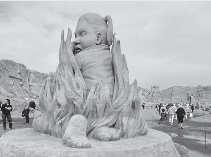
"Vær ikke nervøs, bror, jeg skal nok holde ild i arnen"

Nr. 4 • DECEMBER, 2023 • JANUAR-FEBRUAR, 2024