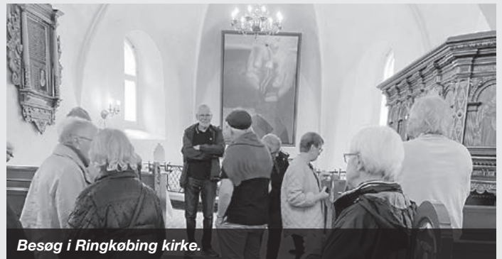
Besøg i Ringkøbing kirke.