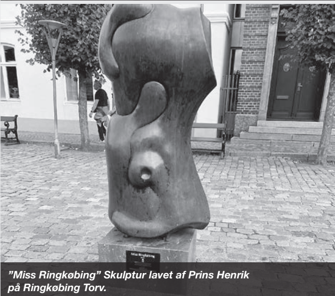
"Miss Ringkøbing" Skulptur lavet af Prins Henrik på Ringkøbing Torv.