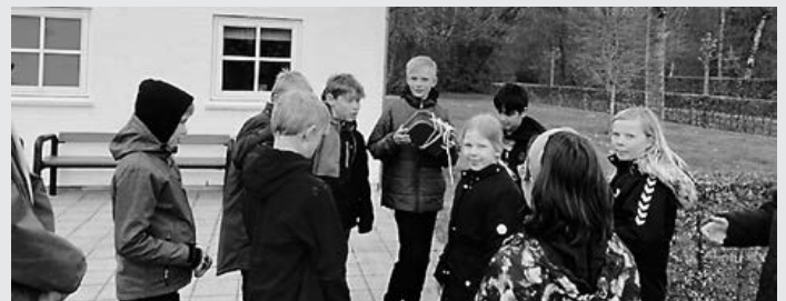
Dagens opgave findes i den blå kuffert.

Alle forældre i 4. klasse vil gerne sige en stor tak til Linda og alle de frivillige i menighedsrådet for en virkelig god uge for vores børn.