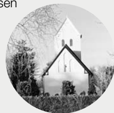
Skrevet af Kim Schmidt